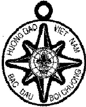
* Huân chương Bắc Đẩu