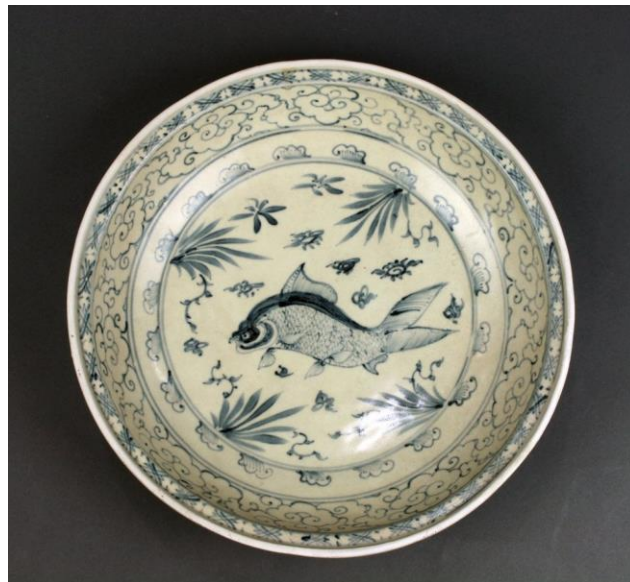
Đĩa Chu Đậu đầu giá ngày 16.6.2019