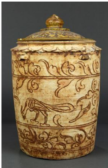
Thạp gốm đời Trần đấu giá ngày 16.6.2019

Cá nhân tôi rất hào hứng thêm một lần nữa. Và chúng tôi thông báo cho nhau để cùng tham dự, cũng là dịp các thân hữu nhiều năm chia sẻ thú vui sưu tầm cổ vật Việt. Tôi ở thành phố đảo Alameda ngay sát Oakland, thân hữu thì nhiều người ở San José, xa nhất là Santa Ana miền Nam California.