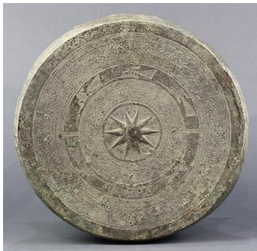
Trống Đông Sơn (nhỏ, đường kính 30cm) trong cuộc đấu giá ngày 16.6.2019 tại Oakland.

California báo cho tôi biết là người này lại giao một số cổ vật đồ đồng, đồ gốm và tượng gỗ cho công ty Clars ở Oakland để bán đấu giá.