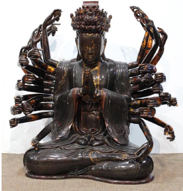
Tượng Bồ Tát Quan Thế Âm 32 tay đấu giá ngày 16.6.2019

Chia sẻ với một nhà sưu tầm cổ vật hiền lành đúng đắn ở San José, anh thân nhiên cho biết rằng anh đã từng thấy dân chơi cổ vật mua tượng Phật về và trịnh trọng dành cả một tầng lầu trong nhà để làm nơi thờ phụng.